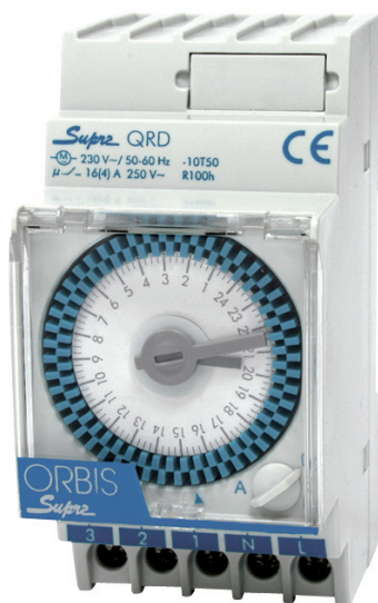
Interruttore orario modulare.