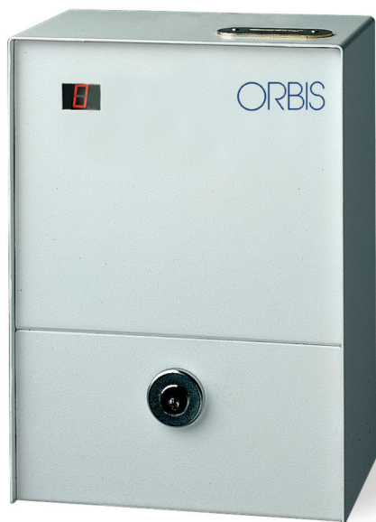
Gettoniera elettronica azionata da gettoni o monete.